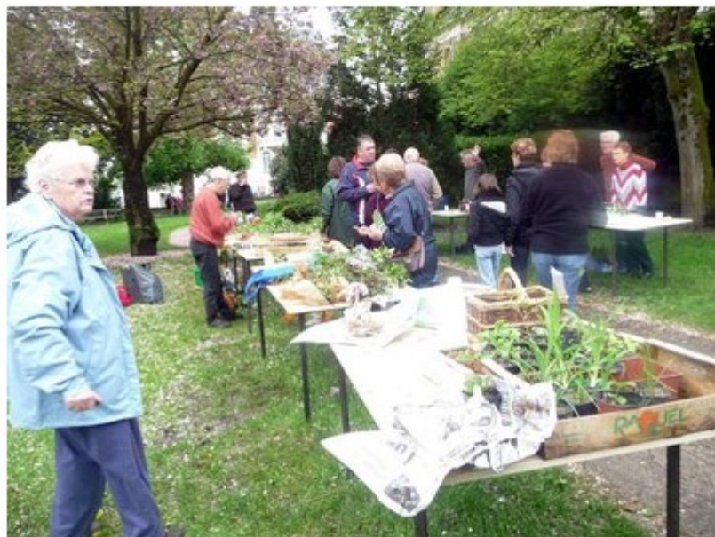
Bourse aux plantes dans le jardin Béluriez.

Un petit café et un morceau de tarte était gracieusement offert, ce qui fut très apprécié des visiteurs. Deux marchés aux plantes sont organisés, un au printemps, un autre à l'automne, prochain rendez-vous au mois de novembre pour la Sainte-Catherine où on trouvera plus de plantes vivaces.